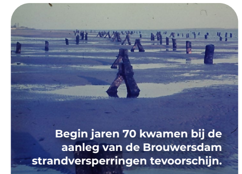
Begin jaren 70 kwamen bij de aanleg van de Brouwersdam strandversperringen tevoorschijn.

Aan de rechterkant van de oprit staat een betonnen paaltje. Deze tref je vaker aan in dit gebied. Het zijn de restanten van de versperringen op het strand die na de oorlog door boeren zijn hergebruikt bij de afzetting van hun land.