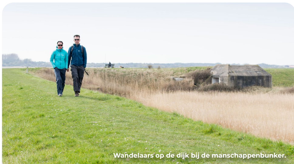
Wandelaars op de dijk bij de manschappenbunker.

Loop de dijk af en loop verder tot aan de weg parallel aan de N57. Ga hier LA. Loop circa 600 meter tot aan het eind bij de weg De Punt.