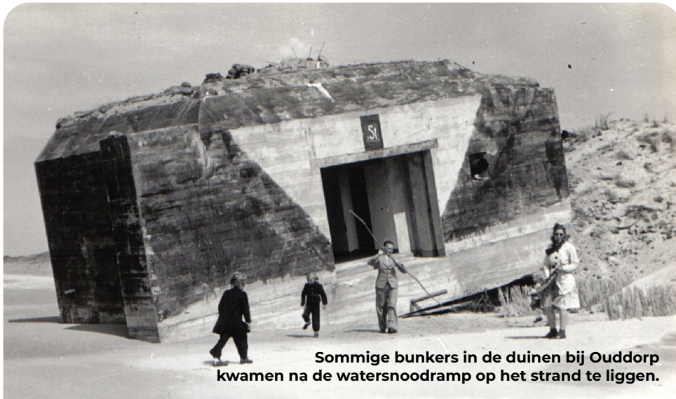
Sommige bunkers in de duinen bij Ouddorp kwamen na de watersnoodramp op het strand te liggen.

Rond de Kop van Goeree liggen de Noordzee en het Grevelingenmeer. In de dijken en duinen bouwden de Duitsers in de oorlog een keten van stellingen om een geallieerde aanval vanaf het water af te slaan. Op slechts enkele plekken zijn hiervan nog overblijfselen te zien.