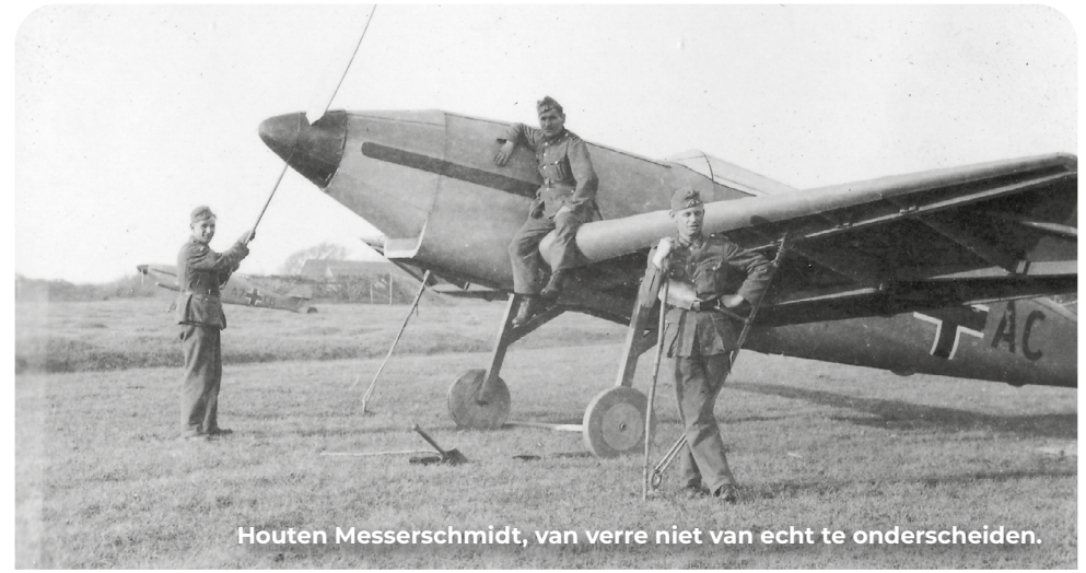
Houten Messerschmidt, van verre niet van echt te onderscheiden.