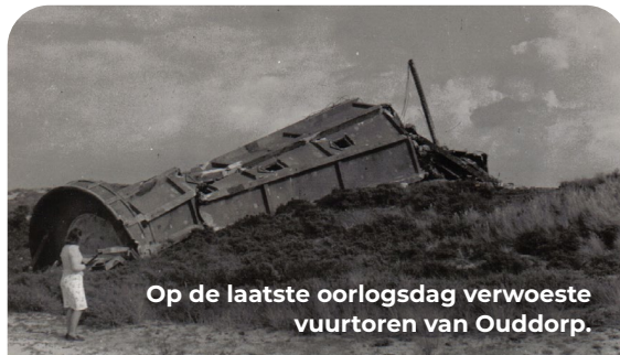
Op de laatste oorlogsdag verwoeste vuurtoren van Ouddorp.

Vanaf het dak van het bunkertje heb je een mooi uitzicht. De vuurtoren van Ouddorp is goed te zien. In de oorlog stond er een andere vijftig meter hoge vuurtoren. Deze gaf destijds de krachtigste bundel licht in Nederland. In 1940 doofde het licht om de geallieerde schepen geen oriëntatiepunt te bieden. De lampen bovenin werden verwijderd om plaats te maken voor een radar die schepen op grote afstand kon signaleren. Ook diende de hoge locatie als meetpost voor zwaar kustgeschut dat op het eiland De Beer stond. In de nacht voor de capitulatie van de Duitse troepen in Nederland is de toren volgens de bevolking opgeblazen. De Duitsers vertelden dat de bliksem was ingeslagen.