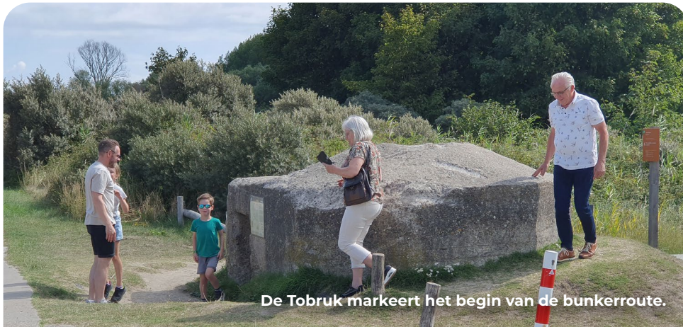
De Tobruk markeert het begin van de bunkerroute.