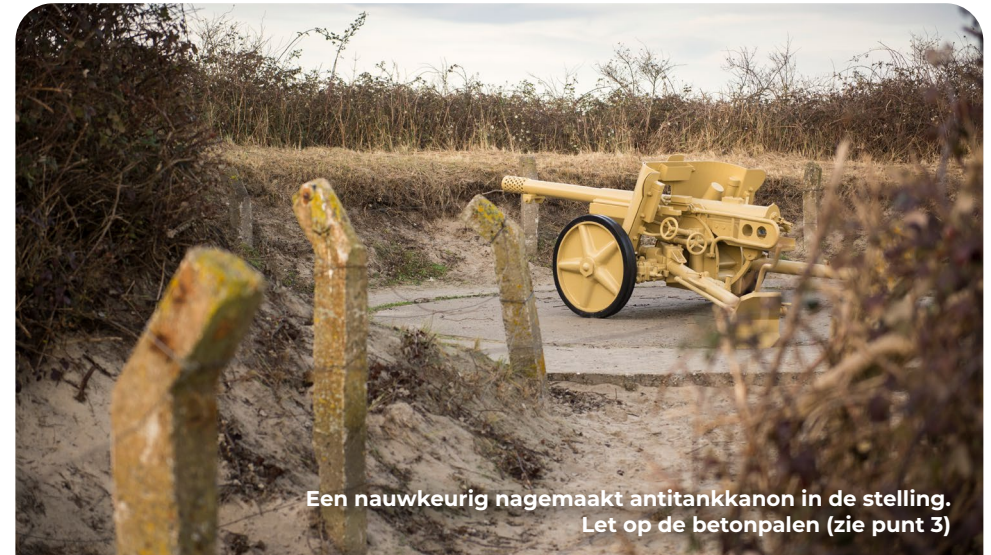
Een nauwkeurig nagemaakt antitankkanon in de stelling. Let op de betonpalen (zie punt 3)

Loop nadat je de stelling hebt bekeken terug naar het duinpad waar je vandaan kwam. Sla daar LA. Na een halve kilometer maakt dit pad een bocht naar links en even later komt het pad uit op de weg 'De Punt'. Sla daar RA en volg de bocht naar links. Je passeert een rode RTM-loods aan je linkerhand en je gaat op de driesprong RD. Even verderop sla je LA over de spoorlijn naar de parkeerplaats waar je de route bent gestart.