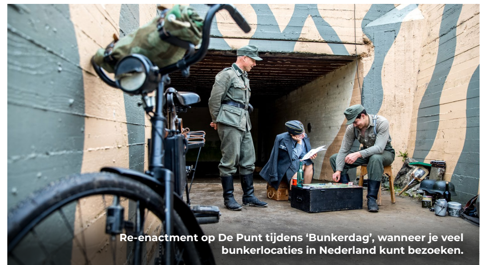
Re-enactment op De Punt tijdens 'Bunkerdag', wanneer je veel bunkerlocaties in Nederland kunt bezoeken.