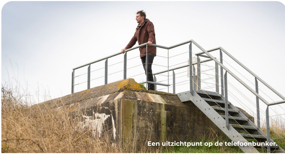
Een uitzichtpunt op de telefoonbunker.