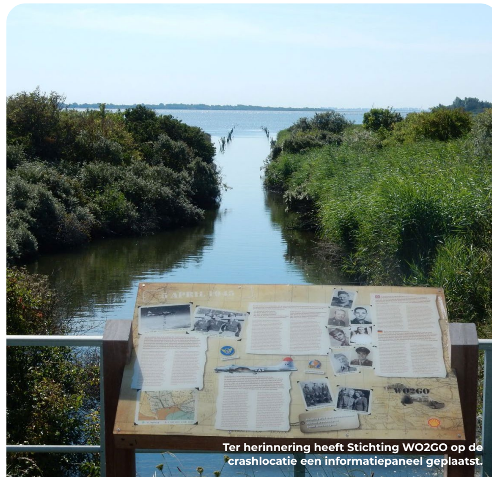
Ter herinnering heeft Stichting WO2GO op de crashlocatie een informatiepaneel geplaatst.